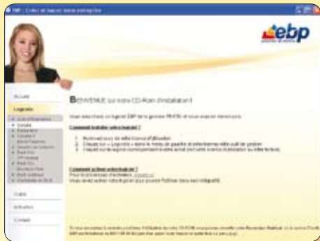
Exemple : EBP Compta Pratic

a) Sélectionnez votre logiciel directement dans le menu